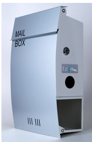
『LEON MB 07』