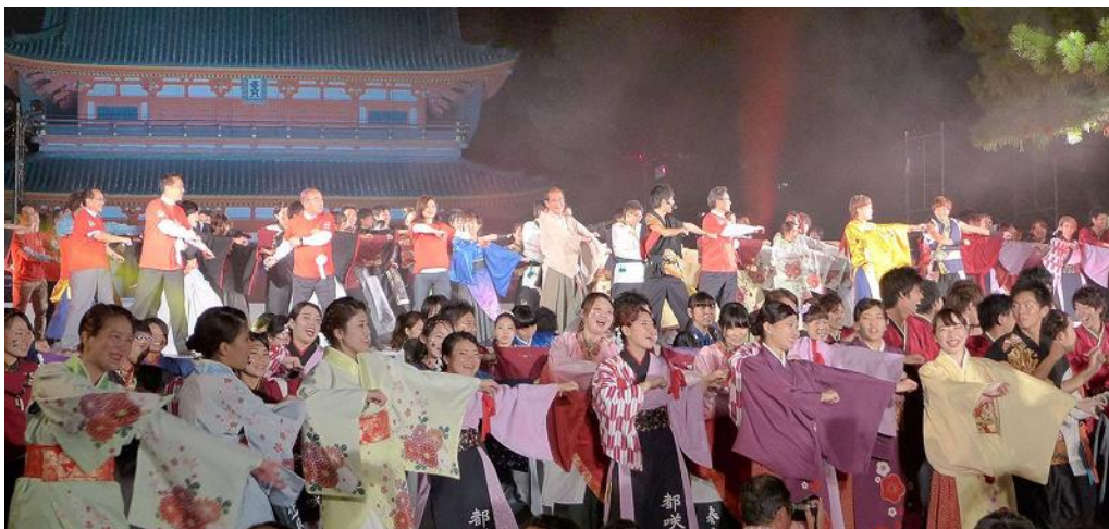
京都学生祭典（イメージ）