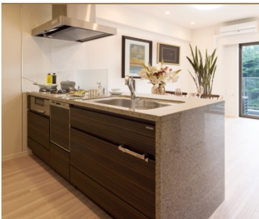
<システムキッチン>