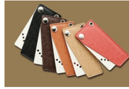
【カードキーイメージ】