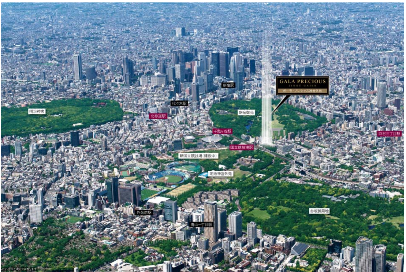
【現地周辺イメージ】