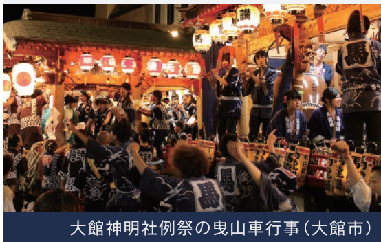
大館神社例祭の曳山車行事(大館市)