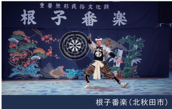
根子番楽(北秋田市)