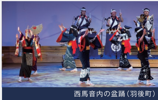
西馬音内の盆踊(羽後町)