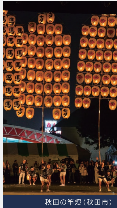
秋田の竿燈(秋田市)