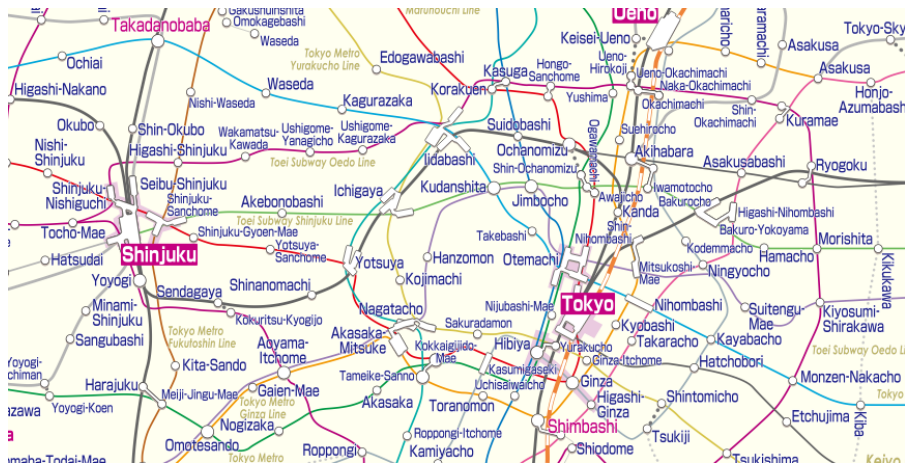
英語版の路線図表示イメージ