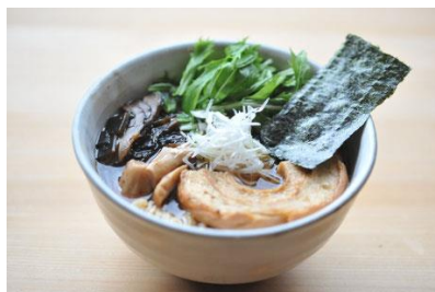
「べじらーめん ゆにわ」のラーメン