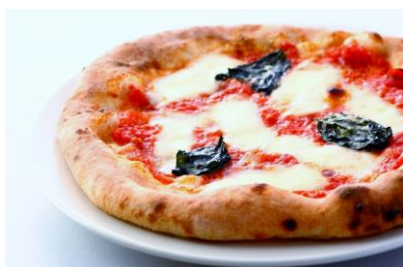
「石窯 PIZZA 屋台 boccheno」のピザ