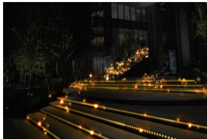
光の帯が上部へと繋がる光壁の様に照らし出し、グラデーションを演出します。(写真：イメージ)