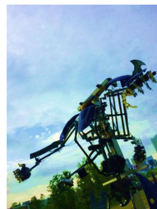
世界初の搭乗型のロボット「スケルトニクス」

立ち込めた霧の中から、美しく照り輝く全長約3mのスケルトニクス2体が、子供達の待つ点灯エリアに向かいゆっくりと動き出します。合図をきっかけに、水面に浮かべられた球体、水盤、街路樹のイルミネーションが一斉に点灯、東京タワーと都会の夜景を正面に構えた品川シーズンテラスの水景を舞台とした水と光の共演が広がります。