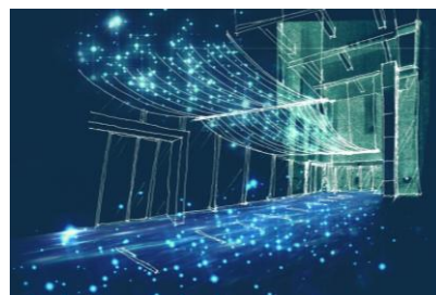
普段よりも暗く演出されたガラスのキューブに囲まれた空間は、光の粒が床や壁にダンスする星雲の中の様な雰囲気です。(写真：イメージ)