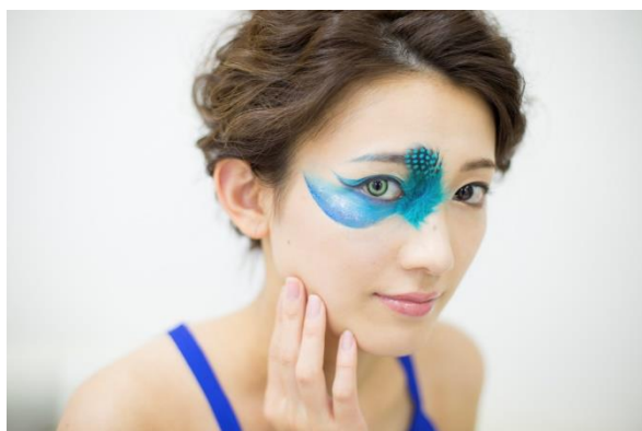
鳥メイク~幸せの青い鳥~

カラフルな6色のアイシャドウとラインストーンできら やかに。青と赤のツートンのまつげがアクセント。