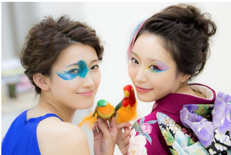
鳥メイク例 左から「幸せの青い鳥」、 「オウム」