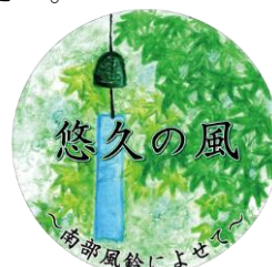
ヘッドマークデザイン