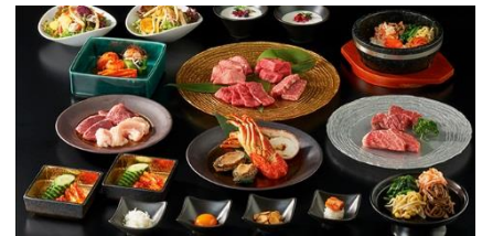
《Tスペシャルコースが 3,000 円に!》

この度の移転リニューアルオープンに際しまして、7/12(水)~7/14(金)の3日間、トラジの魅力が凝縮された特別コース「Tスペシャルコース」の半額イベントを行います。通常価格が 6,000 円(税込・サ別)の T スペシャルコースをこの期間中は 3,000 円(税込・サ別)と特別価格でご提供いたします。さらに、先着 1,000 名様に上野店にてご利用いただけるご優待券 3,000 円分をプレゼントいたします。日頃のお客様への感謝を含めた大変お得なイベントとなっておりますので、是非この期間中に焼肉トラジ上野店へ足をお運びください。