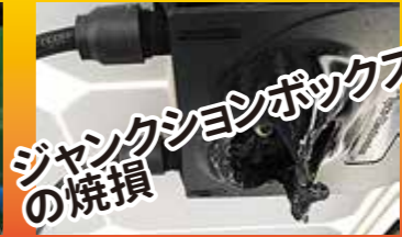
ジャンクションボックスの焼損