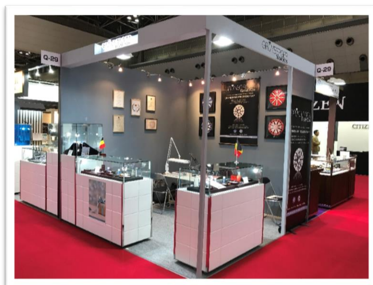
国際宝飾展 秋 [秋の IJT] 会場内 グランバーガーダイヤモンドズジャパン株式会社ブース