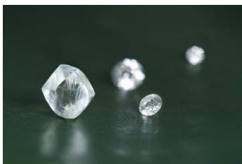
手前(左) カット・研磨前の天然ダイヤモンドと(右) グランバーガープレジジョンカット®完成品メレダイヤモンド