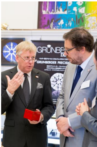
(左より) 献上品の宝石箱を持つギュンテル・スレーワーゲン駐日ベルギー王国大使、「グランバーガーダイヤモンドズジャパン株式会社」サイモン・グランバーガー社長 (於ベルギー王国大使館)