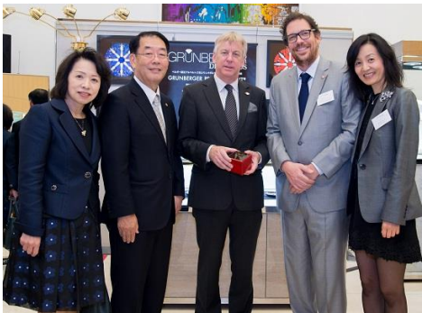
(左より)「株式会社能作」岡会長夫妻、献上品の宝石箱を持つギュンテル・スレーワーゲン駐日ベルギー王国大使、「グランバーガーダイヤモンドズジャパン株式会社」サイモン・グランバーガー社長と広報担当志賀 (於ベルギー王国大使館)