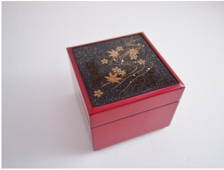
金沢の漆金蒔絵にグランバーガーメレダイヤを散りばめたベルギー王室献上品の宝石箱