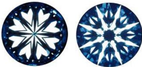
「ハート&キューピッド」