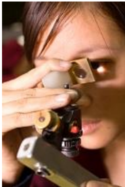
熟練工による高度なカット・研磨技術