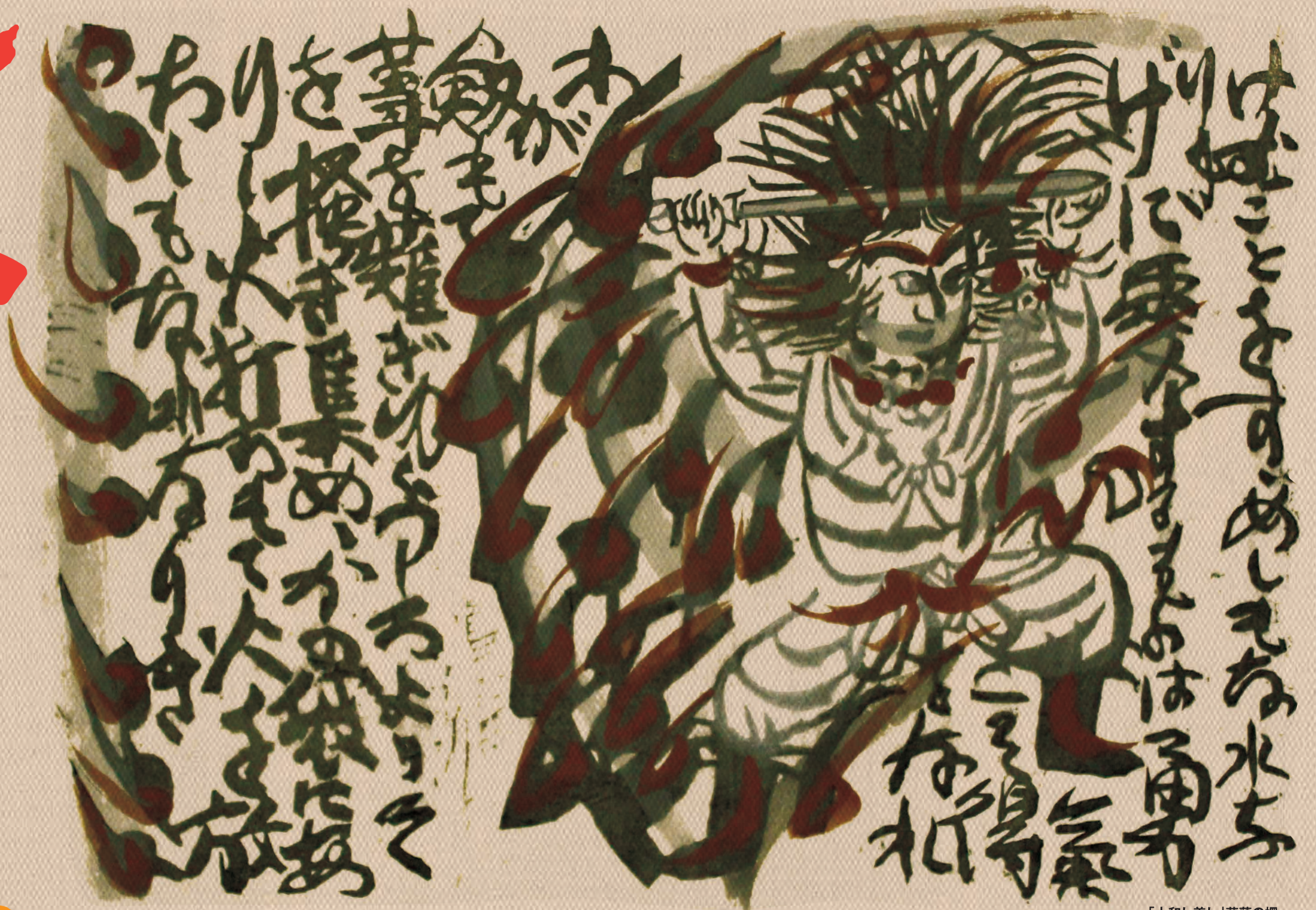
「大和し美し」草薙の柵