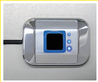
(スイッチ部の写真は実物大)