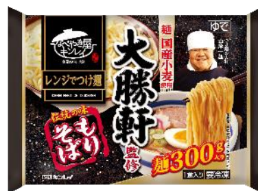
大勝軒監修 伝統の味 もりそば