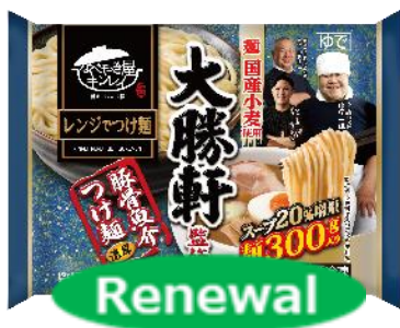
大勝軒監修 豚骨魚介つけ麺

株式会社キンレイ 商品一覧< https://www.kinrei.com/menu/ >