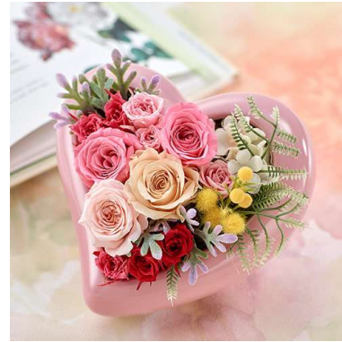
【オンラインショッピングサイト限定】 プリザーブドアレンジメント「ダズンフラワーハート」 税込 4,860 円(本体価格 4,500 円)

「愛する人に12本の花を贈ると幸せになれる」というダズンフラワーをイメージし、ハートのフラワーベースに12輪のプリザーブドローズをあしらったアレンジメント。