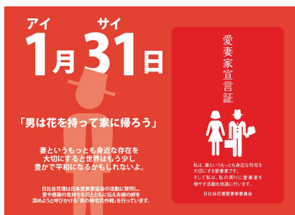
「日比谷花壇特製 愛妻家宣言証」表

足型にあわせて夫婦で立っていただき、夫婦間のコミュニケーションを深めていただく簡易グッズ(紙製マット)です。