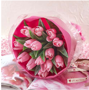
花束「ラブハート」 税込 5,400 円(本体価格 5,000 円)

愛妻の日特別商品として、以下の商品を企画し、これらの商品の注文を、2017年12月19日(火)から受け付けています。オンラインショッピングサイト「hibiyakadan.com」及び全国の日比谷花壇店舗で2018年1月31日(水)までのお届けで注文する場合には、希望に応じて割引特典付き「日比谷花壇特製 愛妻家宣言証」をつけて届けることができます。(※来店での注文受付開始日は、一部店舗で異なります。)