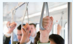
吊り革などを触った後に