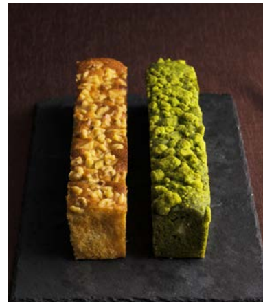
写真左①「こがれ」／写真右②「もえぎ」