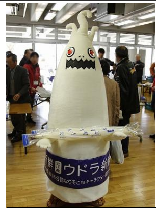
「2018年産うど」とウドラ【2018年産】

「ウドラ」は、立川市にて2013年より市の魅力を伝えるキャラクターとして各イベントで活動を行っており、今年で活動6年目を迎え、2018年の2月16日(金)に立川市役所にて行われたうど品評会にて2代目ウドラとして「ウドラ【2018年産】」が初お披露目となりました。