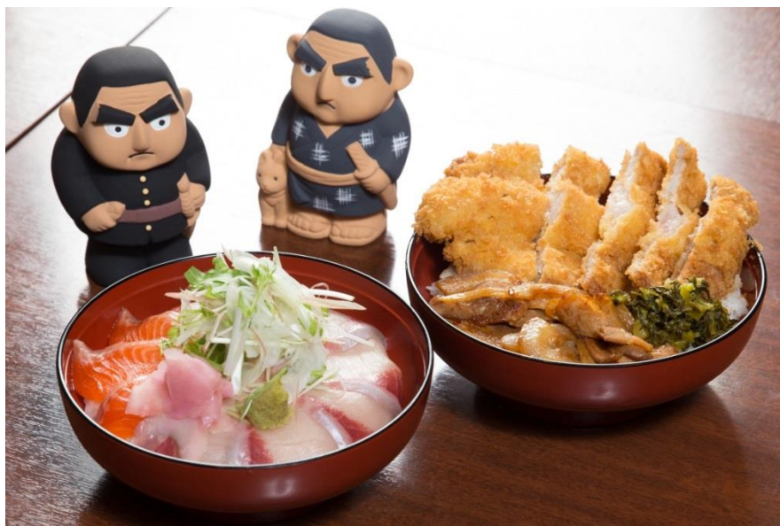
(左から)「霧島ブラック西郷丼・海」、「霧島ブラック西郷丼・山」

鹿児島県霧島市の雄大な自然の中で大切に育てられた稀少な食材を、度量の大きな西郷氏にふさわしく、豪快な丼にした期間限定メニューをぜひお試しください。なお、提供はランチ時間(11:00～15:00)のみ、1日各10食無くなり次第終了です。