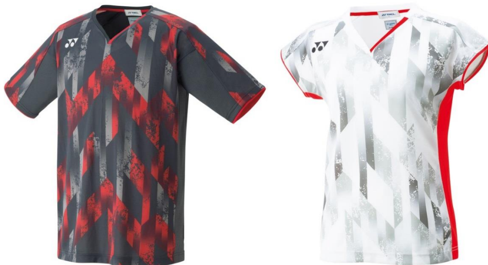
(左)メンズ ゲームシャツ[チャコール] (右)ウィメンズ ゲームシャツ[ホワイト]

ヨネックス株式会社(代表取締役社長:林田 草樹)は、1990年からバドミントン日本代表チームのオフィシャルパートナーとして、選手が最大限のパフォーマンスを発揮できるように高機能・高品質の製品を提供しております。2018年においても引続きチームウェアをはじめとして、ラケットバッグ等の提供によるサポート体制をとってまいります。