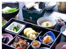
当館自慢、こだわりの和朝食