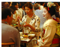
舞妓と楽しくおしゃべり

よく冷えた生ビールやオリジナルの「新粋」はじめ、京都の地酒もご用意。 焼酎も入手困難な元祖「伊佐美」など、米・麦・芋の原材料からお好みに 合わせてお選びいただけます。 その他季節の一品料理もご用意しております。