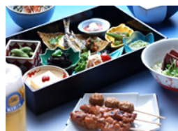
ビアガーデンでのコース料理 (一例)