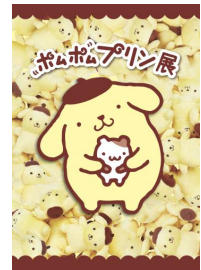
APPROVAL NO. SP581928