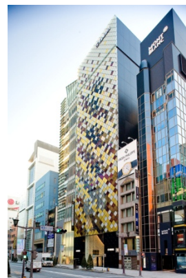
ヤマハ銀座ビル外観