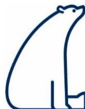
【アイスクャンデー「しろくまのイッチャン」】