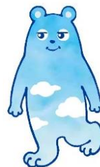
【イメージキャラクター「あべのべあ」】