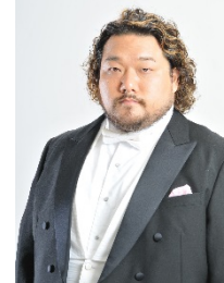
バリトン／小林大祐 繊細かつ豊潤な声を持つバリトン歌手

※やむを得ない事情により、出演者・曲目などが変更になる場合がございます。 ※演奏会中止の場合を除き、チケットの変更・払い戻しはいたしません。 3歳以上～高校生チケット及びサラダ割引チケットの一般チケットへの変更はできかねます。また一般チケットでご入場されても差額の返金はいたしかねます。 ※未就学児入場不可（音楽祭メインコンサート〈ブルミエ・ガラ〉）