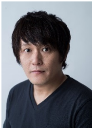
司会/小林顕作 NHK Eテレ「みつけた!」の オフロスキー役で大人気!