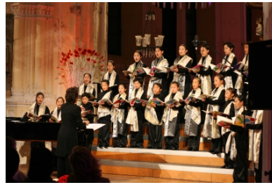
児童合唱/東京少年少女合唱隊 多数のオケと共演する実力派児童合唱