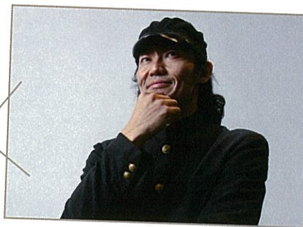
コンドルズ主宰。サラリーマンNEOで大人気! 近藤良平