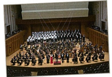
東京五輪(1964)を記念して生まれたオーケストラ 東京都交響楽団