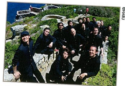
学ラン男性による圧倒的人気のダンス集団 コンドルズ