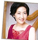
国内外多数のオペラで 活躍するソプラノ歌手 光岡暁恵