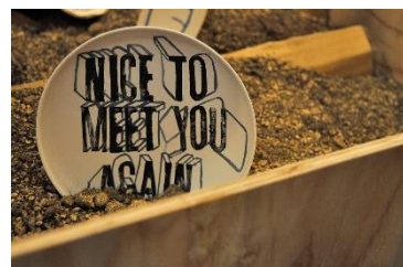
※参加クリエイターの一人 holidayの作品例

図案を作り、版を作る。そして複製を作り、作品の転化を図る。その反復の過程に転がる、ファインアートを考える。