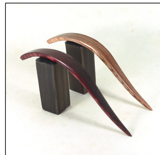
出品例2：木のかんざし