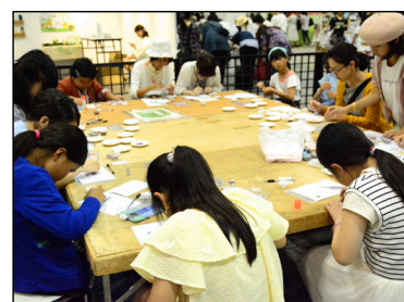
体験教室の様子・2