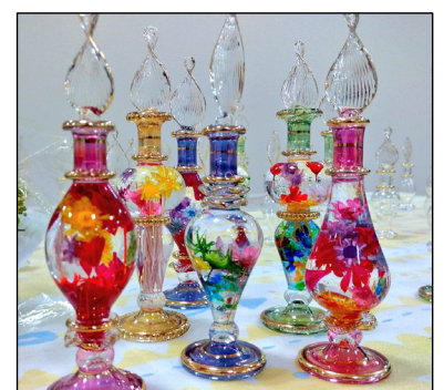
ハーバリウム(植物標本) by 826252