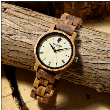
天然木の腕時計 by EINBAND