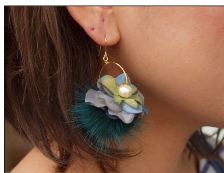
フラワーイヤークセサリー by flare flower