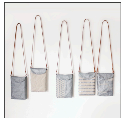
帆布鞆 by SOUPROJECT