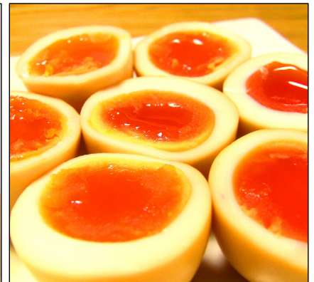
半熟卵のスモーク by 日和佐燻製工房