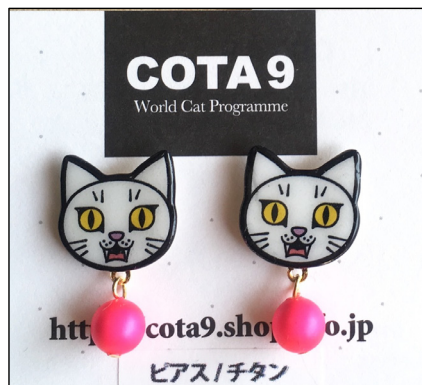
イヤークセサリー by COTA9