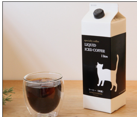
オリジナルコーヒー by KINGLY COFFEE