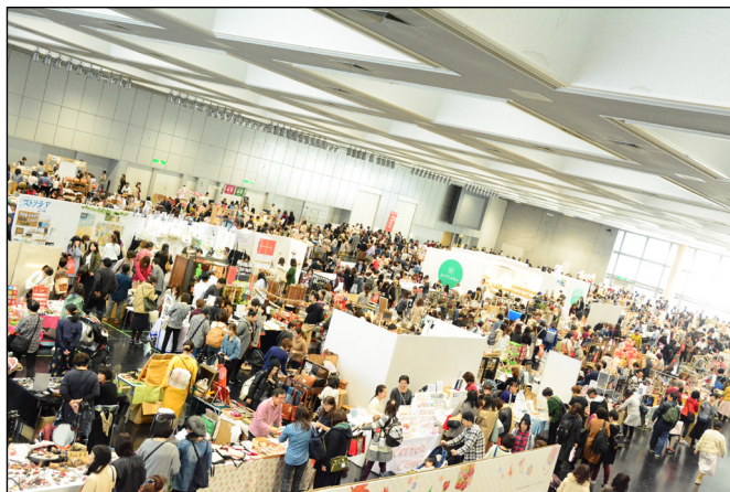
過去開催時の会場の様子▶

京都最大級のハンドメイドイベントとして2017年11月に初開催し今回が2回目となる「京都ハンドメイドマルシェ」。昨年の初開催では6,000人を超える方々が来場しました。会場は、京都最大級のイベント会場「京都市勧業館みやこめッセ」。4,000㎡の会場にハンドメイドの作り手と買い手が集まり、2日間を通じて”ものづくり”を軸とした交流が広がります。