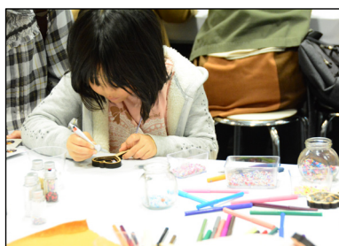
体験教室の様子・1

子供から大人まで、ハンドメイドをしたことがない方でも気軽に参加できる体験教室「マルシェのがっこう」を開催。ものづくり市民が先生となり、アクセサリやフラワーアレンジ、クラフト、伝統工芸まで、 世界にひとつ・自分だけのハンドメイド作品づくり を体験できます。