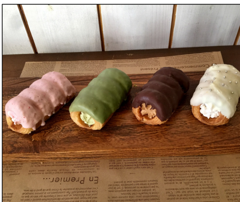
デニッシュ生地のコルネ byル・クロエ