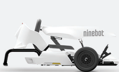
Ninebot GoKart Kit