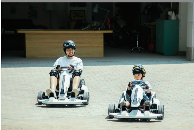
洗練された走行性能

最大走行距離 15km、最高速度 24km/h（スポーツ走行モード時）と充実の機能を搭載。ハンドル、アクセル、ブレーキとレーシングカートと同じく直感的に操作ができ、4輪ならではの安定感、走行感を体験することができます。