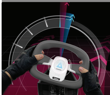
良好なステアリングと快適なコントロール

Ninebot GoKart はNinebot mini Pro と組み合わせたGoKart Kitを指します。GoKart Kit単体での走行はできません。