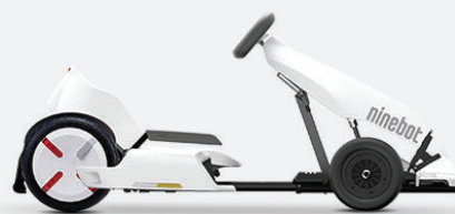
Ninebot miniPRO + Ninebot GoKart Kit