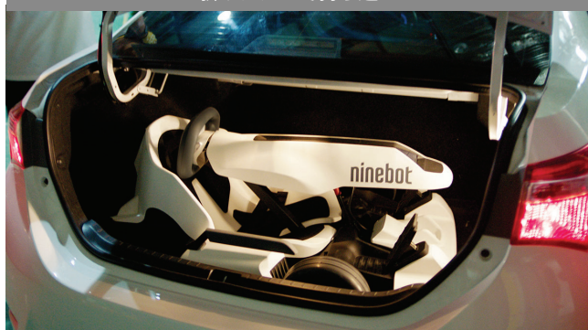
折りたたんで持ち運び

本体を折りたたむとセダンタイプ乗用車のトランクに収納が可能となり、車で遠征することができます。