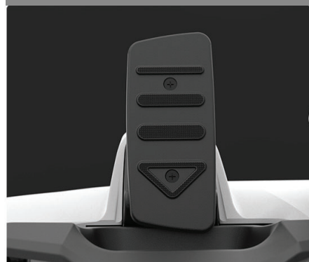
アクセル、ブレーキの2ペダル仕様

右足はアクセル、左足はブレーキとなっています。ブレーキペダルを連続して2度踏むと「前進・後退」を切替えられます。