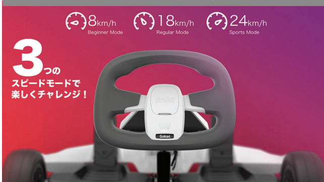
3つのスピードモード

使用するシーンやバッテリー残量に合わせ、スピードモードを選択することが可能です。ビギナーモード(最小電力)、レギュラーモード(中程度の電力)、スポーツモード(最大電力)の3種類を備えています。