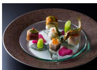
四季の嵐山の情景を映す食事