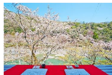
桜を望む空中茶室