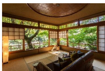
リバービューの客室

今後も多くのお客様に満足していただけるよう快適な空間と、より京都の文化を身近に感じていただけるようなアクティビティを、国内外のお客様に提供していきたいと考えています。