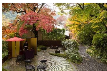
庭で開催される紅葉茶会