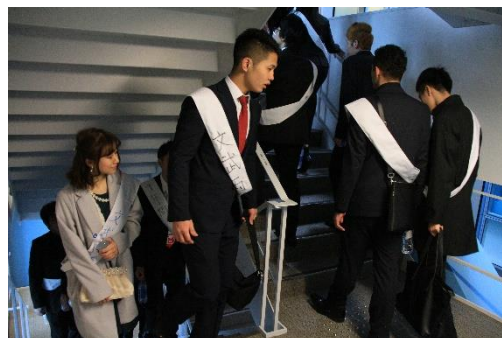
【階段を登る参加者】