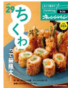
納豆 (2019年2月1日発売) 揚げ(2018年6月14日発売) ちくわ(2018年2月17日発売)

<このリリースに関するお問い合わせ先> 〒105-0004 東京都港区新橋 4-11-1 株式会社オレンジページ 広報室 遠藤 press@orangepage.co.jp Tel 03-3436-8421 Fax 03-3436-8434