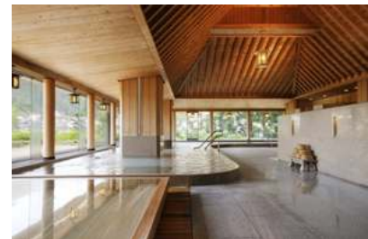
※画像は下呂温泉 水明館(臨川閣)大浴場です。