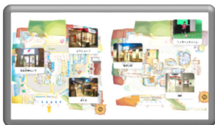
「おしごと紹介ボード」で仕事検索