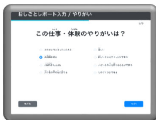
「おしごとレポート」の仕事は タブレット端末で