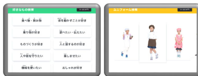
「デジタルキオスク」で手軽に仕事検索