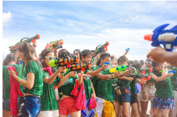
WATER RUN 2018の様子