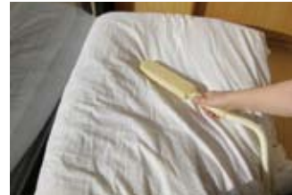
・天日干し後の布団の花粉に