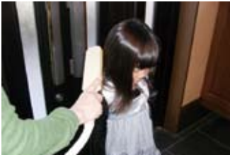
・外出帰りの衣服や髪の毛の花粉に