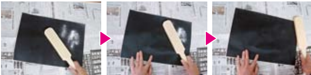
薄紙の上にパウダーを撒きます 花粉棒で吸引します パウダーを吸いとり薄紙は吸い付きません