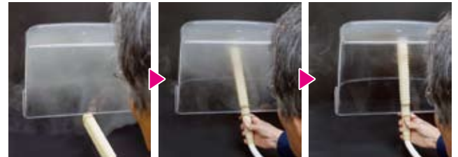
煙を満した透明ケース 花粉棒を差込みます 約4秒で全部吸い取りました、花粉棒を左右に移動すると2.5秒で吸い取りました