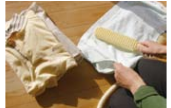
・乾燥後の洗濯物の花粉に