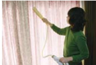
・カーテン、ソファなどお部屋の花粉に