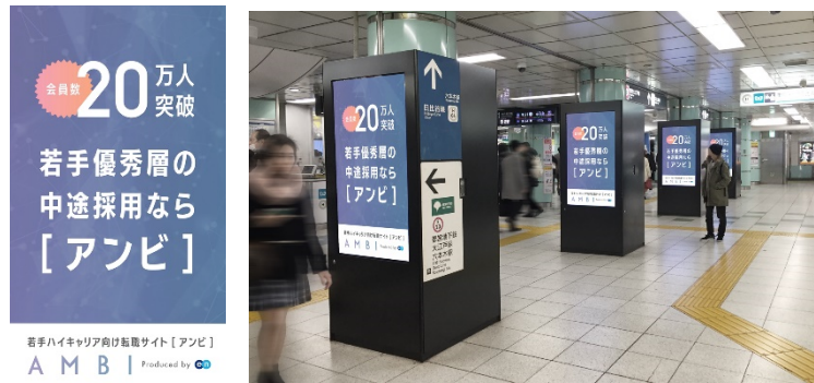
※本件に関するお問い合わせは下記連絡先まで。駅員・係員の方へのお問い合わせはご遠慮ください。