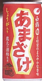
白鶴 あまざけ 缶入り