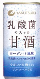
白鶴 乳酸菌の 入った甘酒 缶入り

乳酸菌一〇〇億個配合(フェカリス菌) 米麴仕立てのノンアルコール甘酒。 ヨーグルト風味のやさしい味わいです。