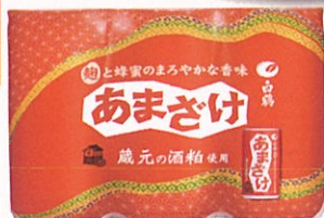
白鶴 あまざけ 6缶セット