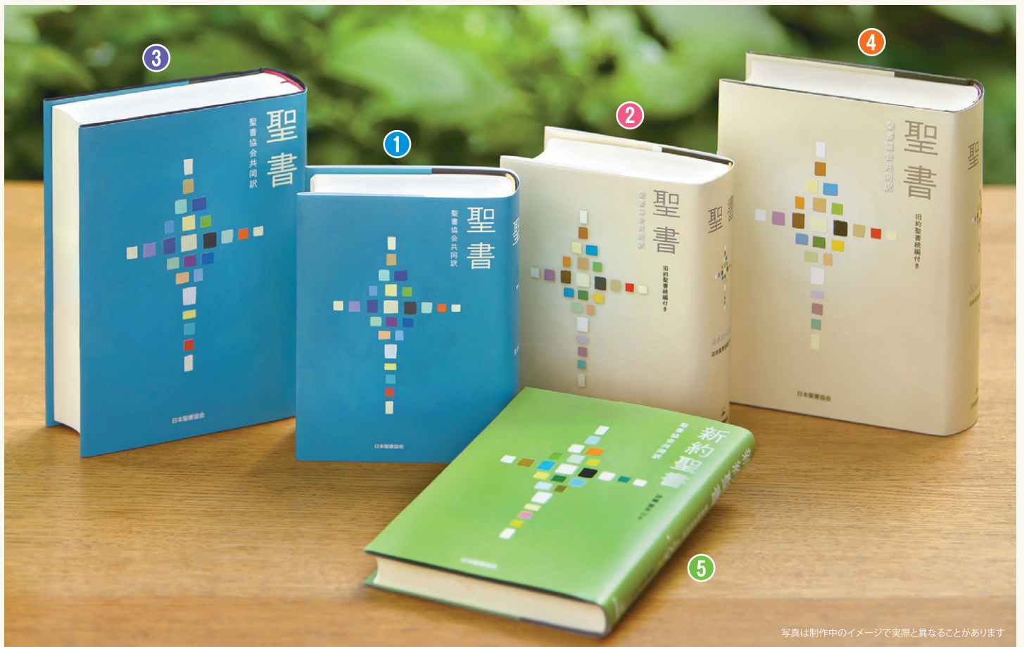
写真は制作中のイメージで実際と異なることがあります