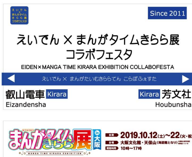
コラボ駅名標のイメージ