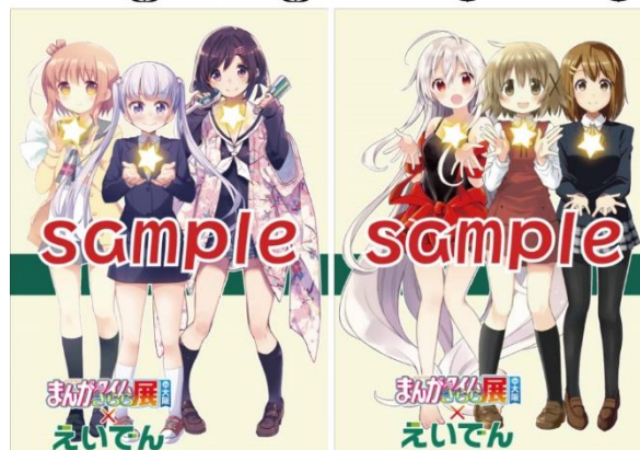
車体側面ラッピングのイメージ