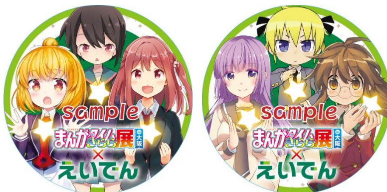
コラボヘッドマークのイメージ