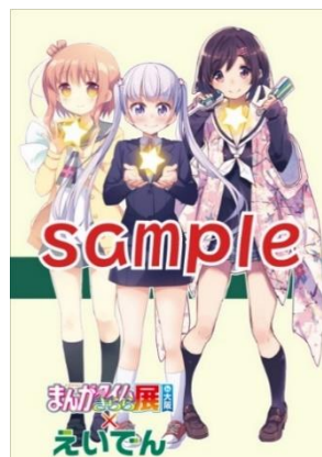
側面ラッピングイメージ