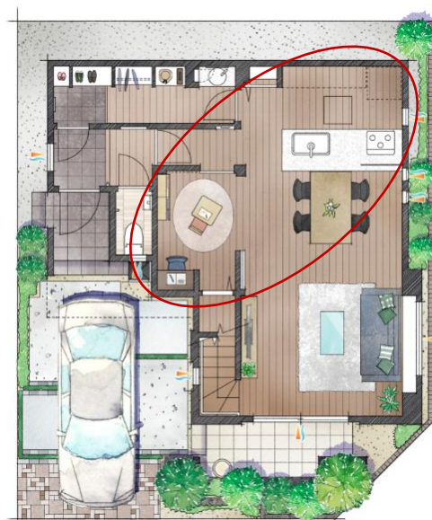
<「家族コーナー」を採用したプラン>

「スマジヨスタイル」や「パパ充スタイル」の詳しい内容は順次、公式ホームページにて紹介していきます。