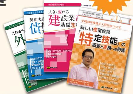
※タイトル、内容はイメージです。

行政書士業務として必ず押さえておきたい最新の動向、建設・入管・宅建・産廃・風俗・運送の主要6分野から、民泊、ドローンなどの新たな分野まで、注目の法令情報、改正情報を、年4回、DVD形式で発送します。