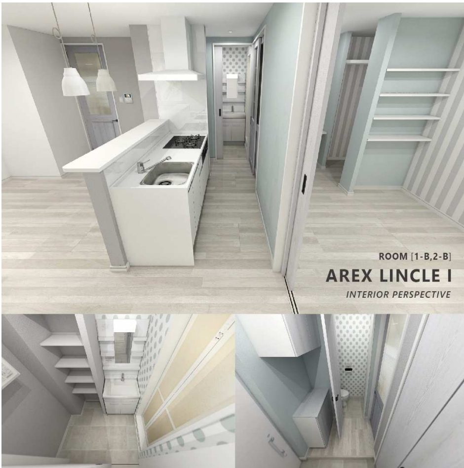
<Arex Lincle I (アレックス・リンクル) 内観パース 1-B,2-B>

「ノルフィーノ」では、コンピューターグラフィックスによる 3D パース製作を導入しています。実写さながらの品質で各部屋の間取りや仕様、デザインが一目で確認できますので、オーナー様からも「安心して建てることできる、わかりやすく打合せも楽しい」と好評を頂いています。また、完成までの入居募集広告にも活用できるため、早期入居の仕掛けとしても最高の素材です。