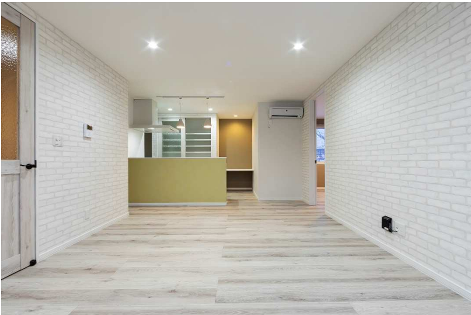
<北海道空知郡奈井江町に建築した「norfino CLASSY」写真>