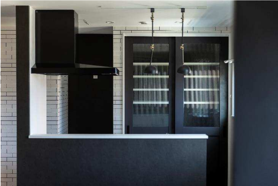
<北海道室蘭市輪西町に建築した「norfino TROIS」写真>

物件完成後はプロのフォトグラファーによる写真撮影を行っています。募集広告の画像も各不動産業者と連携し、実際の写真へ切り替える事で、入居募集のクオリティがさらにアップします。潮産業では物件引渡し後も、満室に向けて最適な募集体制が出来るか、不動産業者さんと一丸となってサポートをさせていただきます。