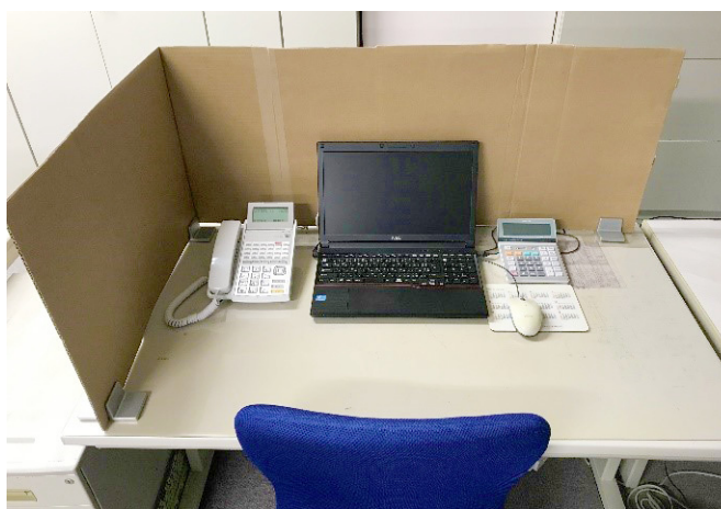
ダンボール箱を任意のサイズにカットした例