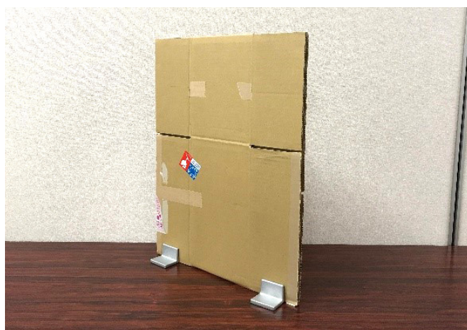
ダンボール箱を畳んだだけでも、即席の仕切りパネルを構築できます