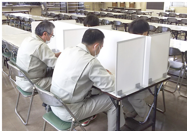
食堂仕切りとしての使用例 (高さ 450mm プラダン使用)