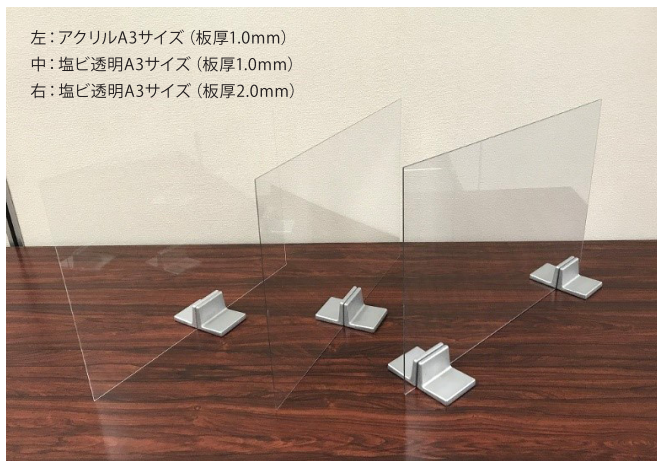
透明アクリル板を使用する事で視界を確保できます