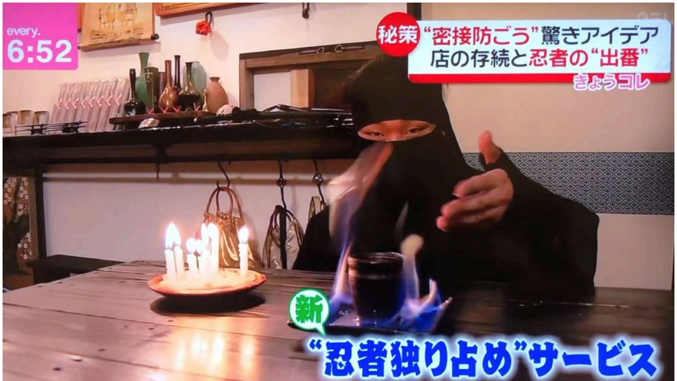
忍者カフェ浅草店での様子（日本テレビ系 news every での様子）

店を完全に1組様限定にて常に貸し切り営業することで、子供と忍者マスターのマンツーマン修行が可能となりました。子供たちに圧倒的な人気を誇る忍者だけに、3密を回避しつつ「安心安全に遊べる」「 忍者マスターを独り占めできる 」という贅沢過ぎるサービスに、サービス開始から連日予約や問い合わせの電話が相次いでいます。