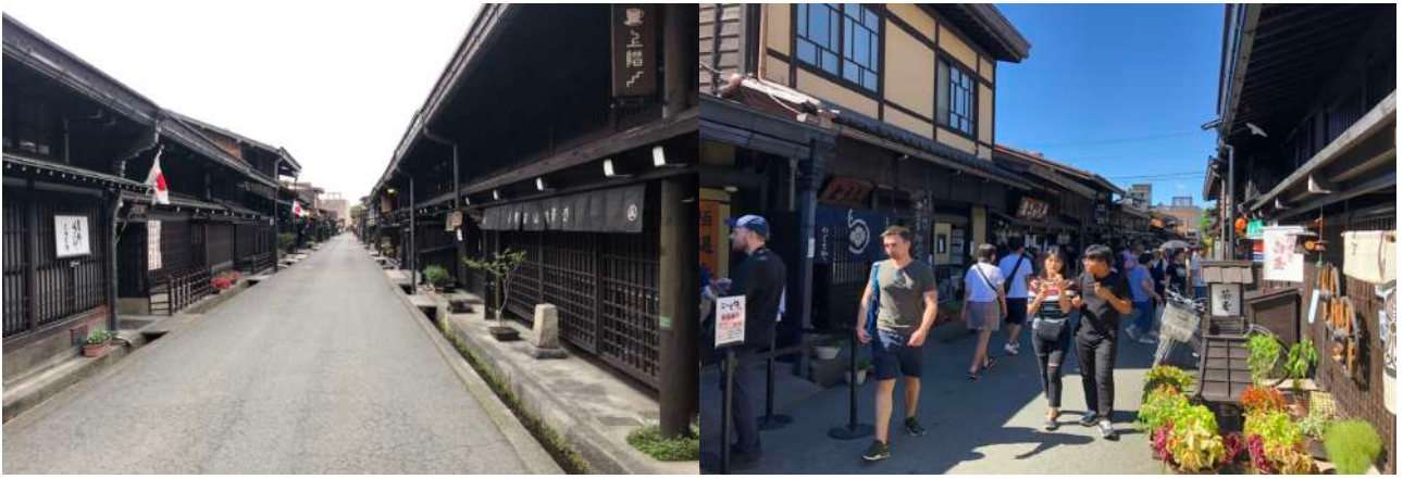
(左)観光客がいなくなり閉店に追い込まれる高山 (右)3ヶ月前の観光客で賑わう高山