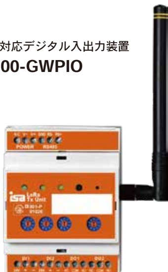
パルス対応デジタル入出力装置 WD100-GWPIO