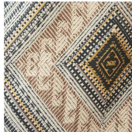
ネイチャーダイヤ