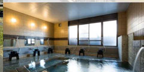
源泉掛け流しの大浴場