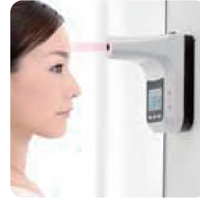
赤外線温度センサー非接触型 温度測定で日常的にチェック

「感染抑止のための新しい衛生手洗いユニット WillX」 ウイルス感染拡大を防ぐために社会的距離をとって人々に「うつさない、うつらない」為にもマスクをして「手をきちんと洗い、除菌をし、うがいをする」新しい行動変異を持続的に 行う新しい生活習慣が促されています。 コロナ禍の時代を生き抜くためにも日常的な予防衛生手洗いが大切です。